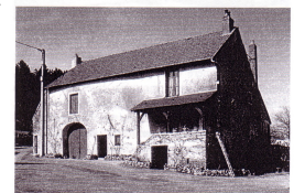
Exploitation viticole à Nuits-Saint-Georges, aux hameaux de Concoeur-et-Corboin