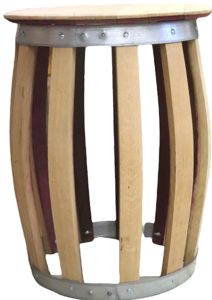
Table haute en chêne fabriqué à partir d'un tonneau 228L ayant élevé nos Grands Vins de Bourgogne. Issu d'un savoir-faire de plus de 2000 ans et de 150 de terroirs français.

Dimensions : Possibilité de choisir la hauteur de votre table ! Hauteur max : 75cm Diamètre haut : 57cm Diamètre bas : 52cm Gravage personnalisé possible