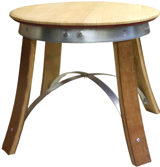
Table basse en chêne fabriqué à partir d'un tonneau 228L ayant élevé nos Grands Vins de Bourgogne. Issu d'un savoir-faire de plus de 2000 ans et de 150 de terroirs français.

Dimensions : Hauteur : 50 cm Diamètre haut : 57cm Diamètre entre deux pieds : 75 cm Gravage personnalisé possible