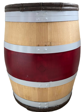
Tonneaux poncés cercles peints Coque rouge

Épaisseur : 27 mm Diamètre tête : 60 cm Diamètre bouge : 72cm Hauteur 88 cm Poids : 50Kg