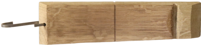
Planche à découper avec une rainure pour couper vos aliments plus facilement et avec un trou pour l'accrocher où vous voulez !