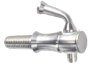
ROBINET INOX 12MM

Mise en place des robinets bois : l'enfoncer légèrement avec un coup de marteau