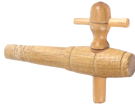
ROBINET 12 MM