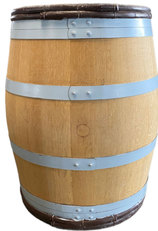
Tonneaux poncés cercles peints