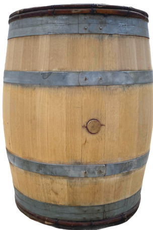
Tonneaux poncés Brut