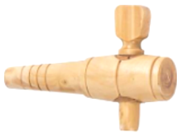
ROBINET 10 MM

Robinets bois et inox pour vos tonnelets et vinaigriers